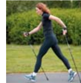
3. Axlar afslappaðar og klára frásprynna.