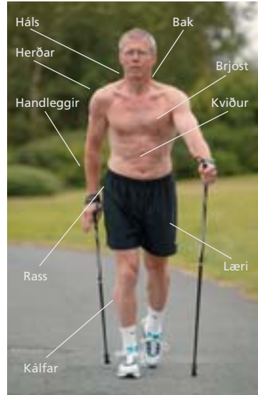
Stafganga styrkir kvið, rass, læri, kálfa, axla-, brjóst-, upphandleggs- og bakvöðva.

Stafganga er notuð í endurhæfingu fyrir þá sem eru að ná sér eftir meiðsli eða sjúkdóma t.d. gigtar-, bak-, hjarta- og lungnasjúklinga og hentar vel fyrir einstaklinga yfir kjörþyngd. Stafirnir eru einnig góður stuðningur og áhrifarík viðbótarþjálfun fyrir línuskautafólk.