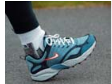
Komið niður á hæl, góð kreppa í ökkla.

Láttu fótinn „rúlla“ í gegnum skrefið þegar þú gengur, þ.e. byrjar að stíga niður á hælinn, rúllar fram á tábergið og spyrnir áfram. Ef spyrnan er rétt áttu að finna hvernig aftanverðir lærvöðvar og rassvöðvar verða virkir. Það er mikilvægt að slaka á og gefa sér tíma í skrefinu.