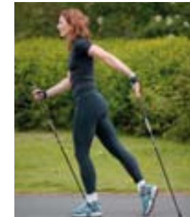
4. Réttu úr olnboga og opna lófann áður en framsveifla hefst.