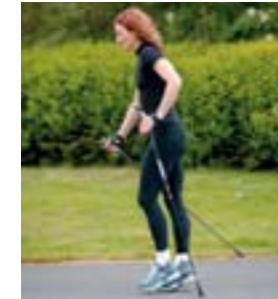
2. Rúlla vel í skrefinu og ýta sér áfram með stafnum.