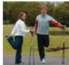
3. Framanverðir lærvöðvar.