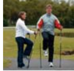
2. Háar hnélyftur.