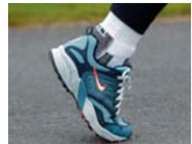
Spyrnt fram á við.

Gakktu rösklega og lengdu skrefin. Gættu þess að: