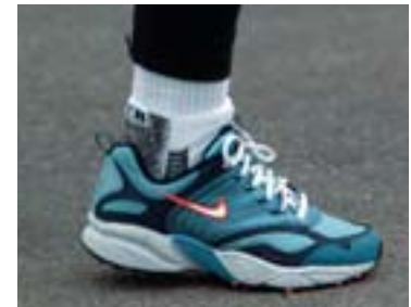
Rúllað í gegnum skrefið fram á tábergið.