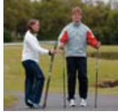
1. Ganga á staðnum.

Eftirfarandi æfingar er hægt að endurtaka 10 - 20 sinnum.