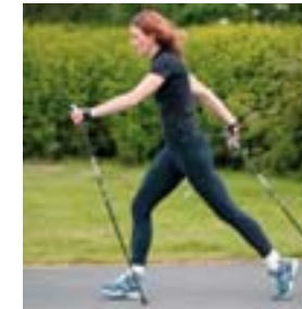
1. Vinstri staf er stungið í jörðina á móts við hægri hæl.