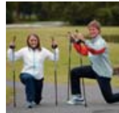
5. Beygvöðvar mjaðma.