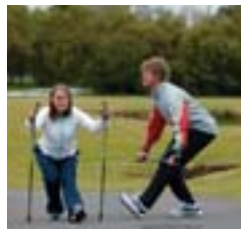
2. Aftanverðir lærvöðvar.