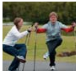
4. Rassvöðvar (réttivöðvar mjaðma).